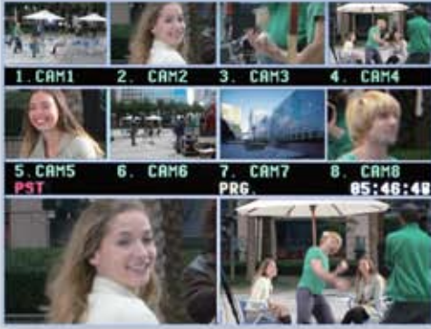
Multi Image Preview Output